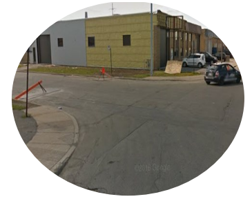
4. Aucun marquage au sol et voiture stationnée à moins de 5 mètres