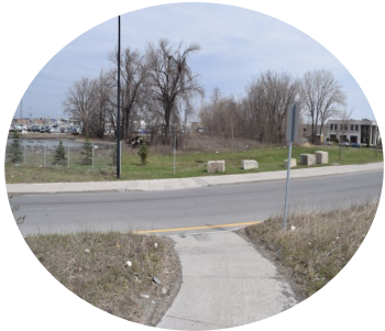
1. Traverse mi-tronçon non-protégée (courbe, pente, vitesse...)