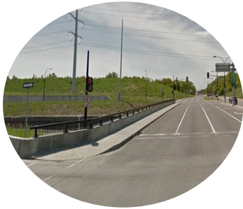
1. Clôture de protection du pont A-25 de hauteur insuffisante