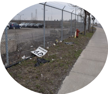
3. Panneau de vitesse au sol et présence de déchets