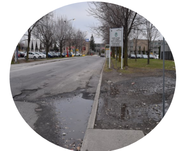
5. Trottoir discontinue