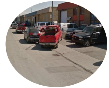
5. Voiture stationnée sur la voir piétonne