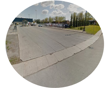
4. Immense entrée charretière non-protégée (Sobey's)