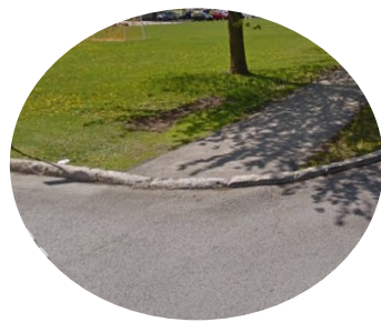
3. Bateau pavé en mauvais état et aucune connectivité de la voie piétonne