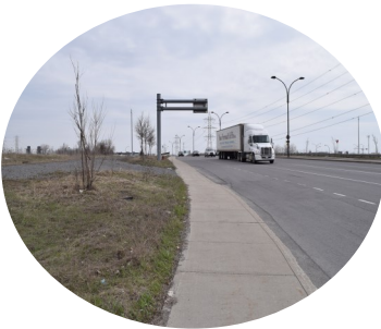
2. Îlots de chaleur, voie piétonne de largeur insuffisante et vitesse