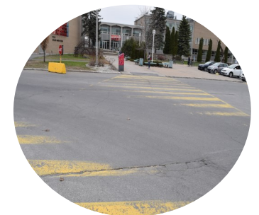
6. Marquage au sol pour piétons peu visible