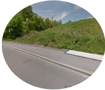
2. Piste cyclable discontinue